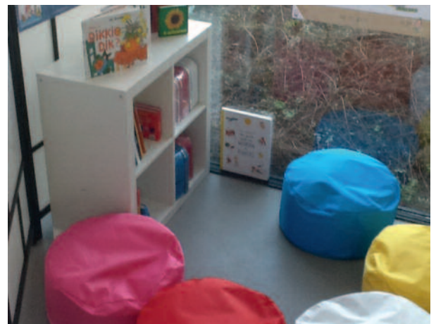
Voorleeshoek na de training (Kapelle)