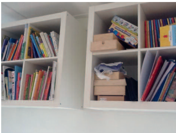
Voorleeshoek voor de training (Kapelle)